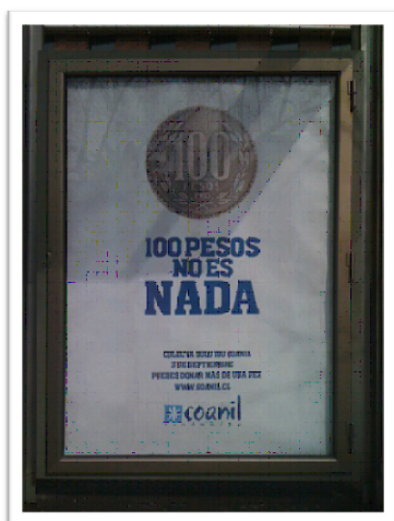
Fotografía tomada en una estación de buses en Santiago